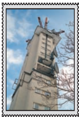
Wieża telewizyjna – Katowice

Bytom • Chorzów • Katowice • Ruda Śląska • Siemianowice Śl. • Świętochłowice • Zabrze Rok LII Nr 9/2678 5 – 11.03.2009 r. Nr indeksu 359300 Cena 1,50 zł (w tym 7% VAT)