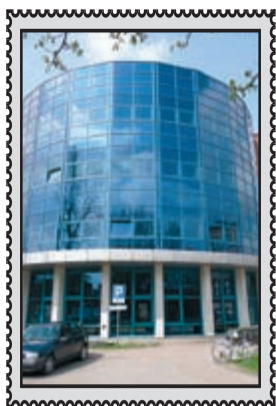
PGNiG w Świętochłowicach

Bytom • Chorzów • Katowice • Ruda Śląska • Siemianowice Śl. • Świętochłowice • Zabrze Rok LII Nr 15/2684 16 – 22.04.2009 r. Nr indeksu 359300 Cena 1,50 zł (w tym 7% VAT)