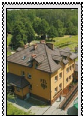
Strzelnica myśliwska w Siemianowicach Śl.

Bytom • Chorzów • Katowice • Ruda Śląska • Siemianowice Śl. • Świętochłowice • Zabrze Rok LII Nr 20/2689 21-27.05.2009 r. Nr indeksu 359300 Cena 1,50 zł (w tym 7% VAT)