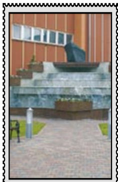
Fontanna przy rondzie w Siemianowicach Śl.