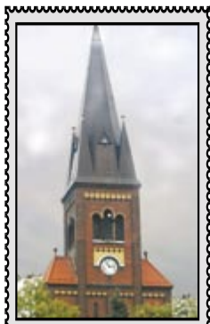
Wieża kościoła pw. Michała Archanioła w Siemianowicach Śl.