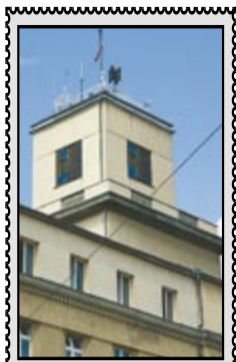
Wieża Ratusza w Chorzowie