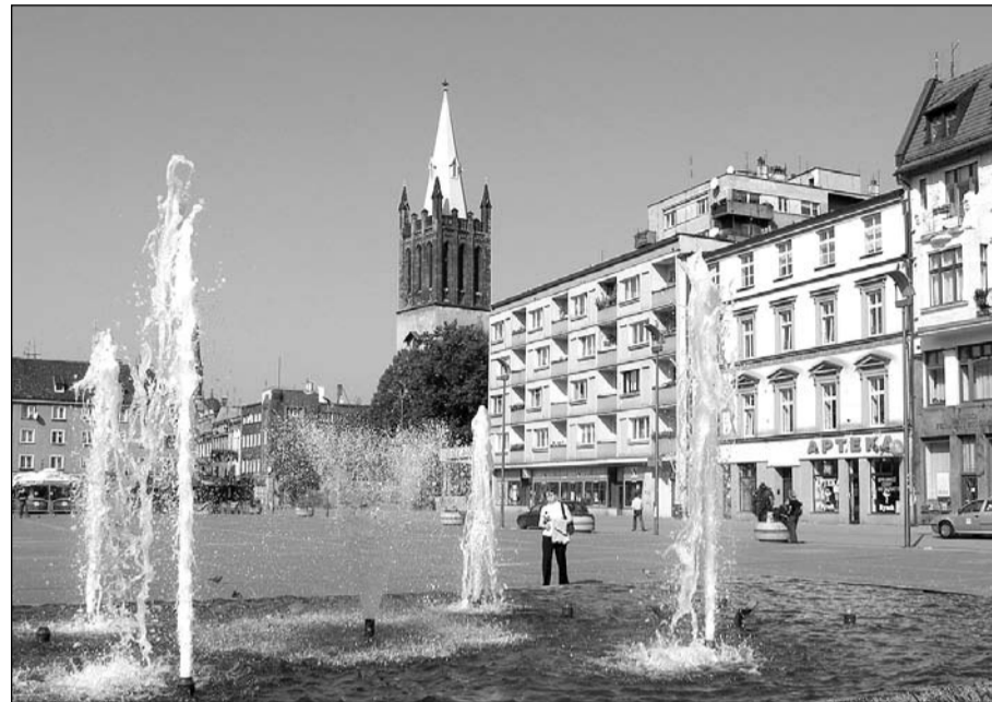
Duża część instalacji wodociągowych w Bytomiu jest przestarzała

Toteż przed Bytomiem w najbliższych latach stoją poważne zadania w opisanych dziedzinach. Trzeba będzie m. in. wymienić wyeksploatowane przewody wodociągowe. Załącznik do uchwały Rady