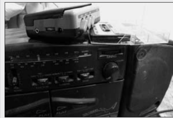
Zużyty sprzęt można oddać za darmo

Ruda Śląska • Jeszcze tylko dziś (czwartek 16.X) i jutro (piątek 17.X) trwać będzie na terenie miasta zbiórka zużytego sprzętu elektrycznego oraz elektronicznego. Na zlecenie władz miasta przeprowadzą ją od 6 października Przedsiębiorstwo Usług Komunalnych sp. z o.o.