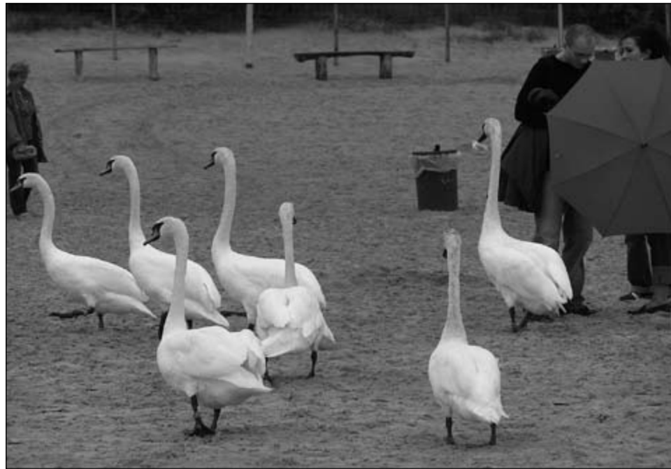
Nie należy dokarmiać żadnych ptaków w mieście

Jak się okazuje, dziki nie są jedynymi zwierzętami, z jakimi był ostatnio w Bytomiu